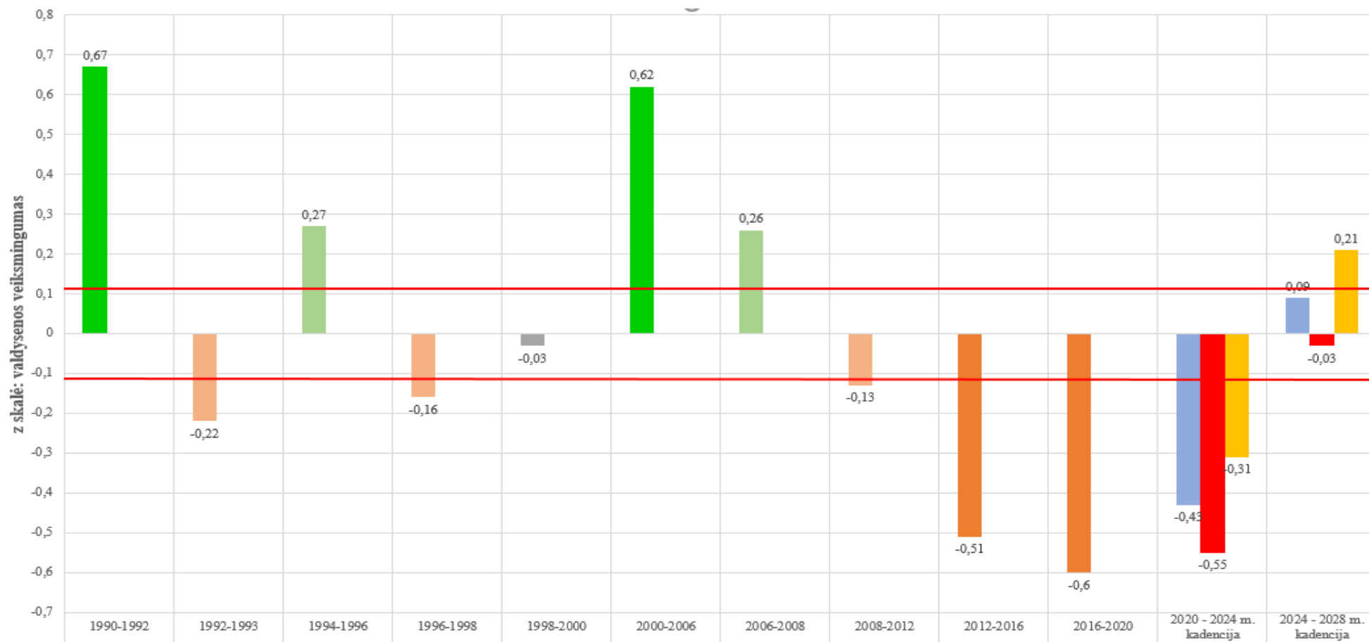
3.1 pav. Švietimo valdysenos veiksmingumo prognozavimo iki 2028 m. trendas, paremtas analogiško rodiklio 1990-2020 m. duomenimis. Prognozavimo metodas – Maximum Likelihood metodas.